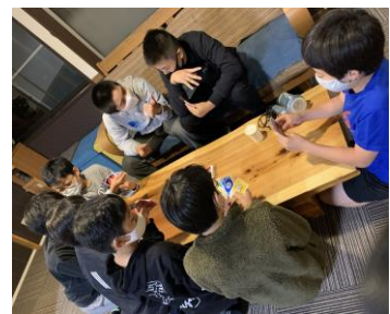
この時間が楽しい！