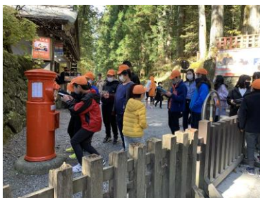
日光から手紙投函

何よりこのような状況の中、保護者の方々にご理解・ご協力いただいたことに感謝いたします。ありがとうございました。