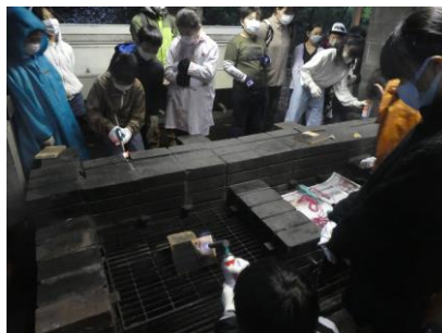
初体験 焼き板作り