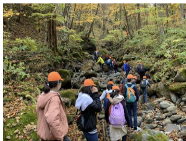
紅葉の沢登り！楽しい！