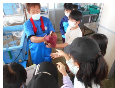
生きているアナゴ！