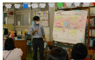
峯小の強みをどう生かしていくかを発表