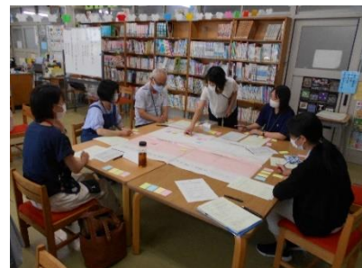
4つのグループに分かれて討議