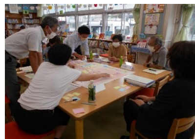
付箋を使って考えを集約