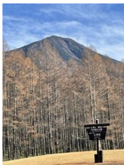
三本松からの男体山