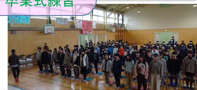
5・6年生が一堂に会する卒業式練習が始まりました。高学年の緊張感が伝わってきます。