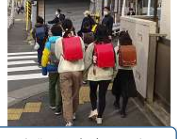
吐く息も白くけむるような寒い朝が続きます。毎朝の登校見守り有難うございます。