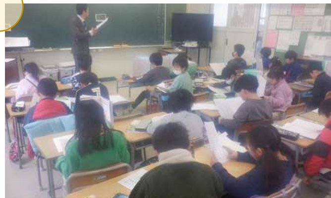
2年生 国語では物語の読み聞かせを聴いたり、歴史上の人物の言葉集めに取り組んだりしました。