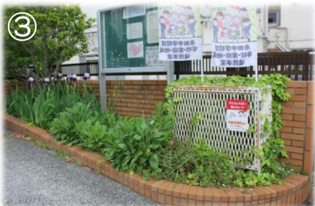
③④ 正門のビフォー・アフターです。雑草を抜いて、菖蒲の横にイタリアンラベンダーを移植しました。