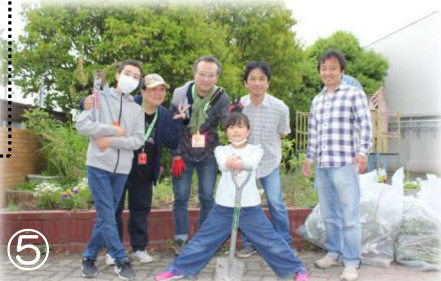
⑤ シークレットミッション(?)完了!!

① ビフォー。大きくなったオリーブの木が花壇の大半を占めてしまっています。他にもカラスノエンドウなど、とにかく雑草がボッサボサ(ノノ)横浜市のバラ「はまみらい」も雑草に埋もれていました。