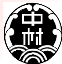
中村小学校 Tel 261-1984