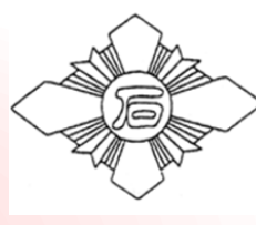
石川小学校 Tel 261-0743