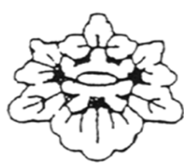
山元小学校 Tel 641-4857