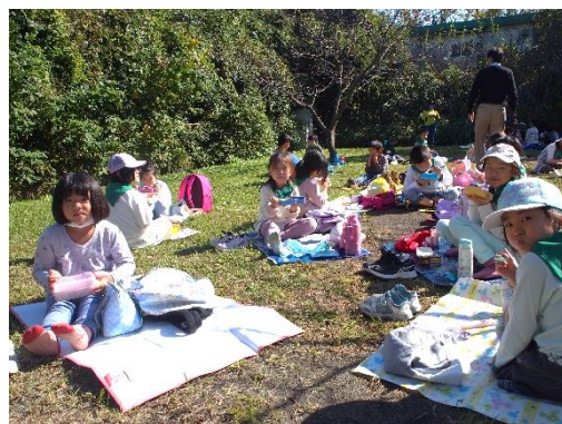
おべんとうもおいしかった!