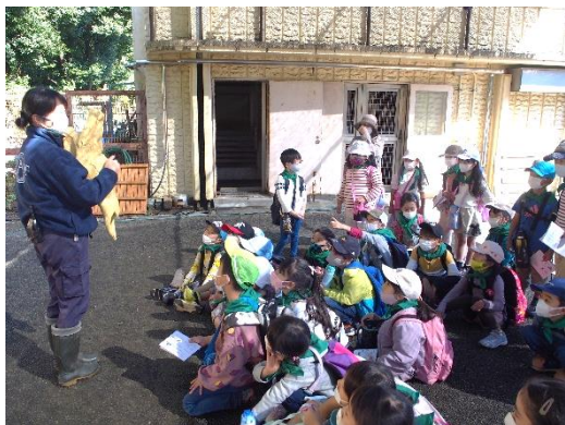
飼育員さんのお話は、「へえ」の連続でした

10月28日(木)に、金沢動物園に遠足に行ってきました。「バスに乗ると、普通の車が小さいね!子どもみたい!」と、行きのバスから大盛り上がり。動物園では、キリンにオカピ、コアラ、カンガルー。たくさんの草食動物を楽しみましたが、1番夢中になってみていたのはぞう。その大きさに大興奮。「あんなに大きいから1日に100キロも食べるんだね。」と、飼育員さんの説明を思い出しながら、その迫力ある姿を楽しみました。また、しおりに載っている地図を確認しながら「次はどのコースに進むの?」「次に出てくるのはオカピだね」と、見通しをもちながら楽しむ様子も見られ、成長を感じました。来年の遠足ではきっと上手にグループ活動ができるのだろうと、頼もしく思いました。その後の国語の学習では、絵日記をのびのびと描きました。