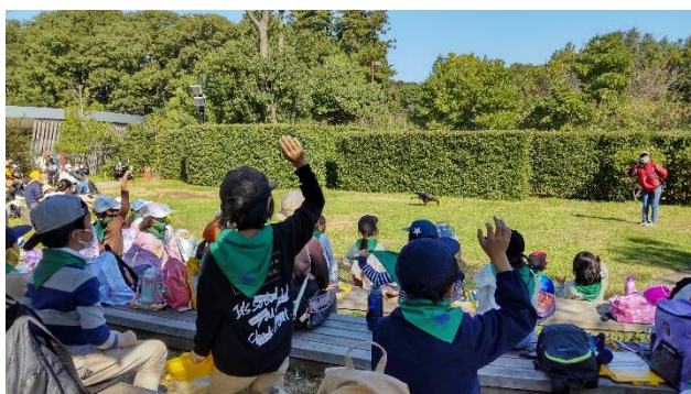
迫力のあるバードショーはすごかったです

「わたしは、バードショーでいろいろな鳥が出てきておもしろかったです。その中でも、わたしがおどろいた鳥が、夜のハンターみみずくです。なぜかという、とぶときしずかにとべるのがすごいからです。ほかにも、音だけでえもののいちがわかるのがすごいと思いました。」