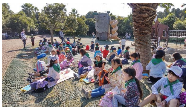
おやつタイムも楽しんでいます