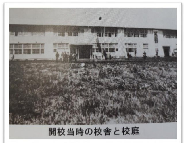
開校当時の校舎と校庭

から3年生までは午前と午後に分かれて2部授業を行いました。また、当時プールはありませんでした。昭和40年(1965年)、待ちに待った講堂ができました。そして、この年の卒業式が新しい講堂で行われました。それまでは、コンクリートでほそうされた中庭で卒業式や入学式が行われていました。講堂が完成したあとは、行事や雨の日の体育祭の学習も心配なく行えるようになり、子どもたちは大喜びしました。昭和41年(1966年)7月4日、待ちのぞんだプールが完成し、この年から体育の学習で水泳が行われるようになりました。(資料は創立60周年記念地域・歴史資料より抜粋)