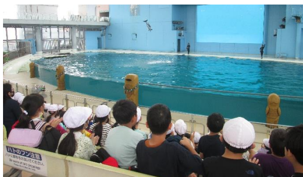
【海の動物たちのショー】