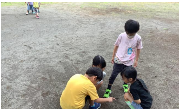
【大熊公園】グループ活動を楽しみました！