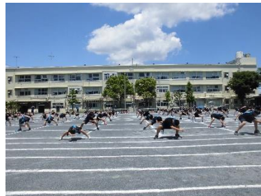
5・6年生のソーラン節