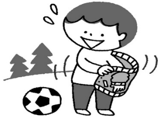
部屋の中でも外でも、寒さに合わせた衣服の調節