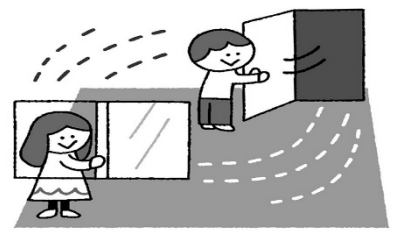
換気しよう、家でも学校でも! 部屋の空気が汚れる前に