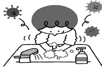
外から帰ってきたときは、石けんであわあわ手洗い、感染予防