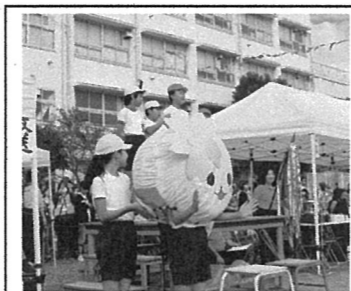
〇さくらんまるが登場しました！

私たち教職員は、子どもたちが本番で最高のパフォーマンスが発揮できるように練習過程を大切に指導して参りました。「運動会すばらしかったです。子どもたちの成長を感じました。」「楽しく和やかに運動会を盛り上げていました。さくらっ子は一つですね。」等・・・参観いただいた保護者、地域の方々からあたたかいお言葉をいただきとても励みになりました。今後も子どもたちへの健やかな成長につながる指導の充実を図っていきます。本当にありがとうございました。