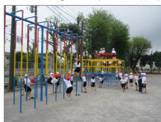
体育、楽しいな。 (1年1組)