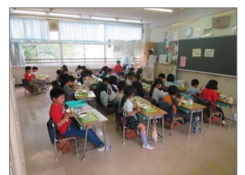
給食、おいしいよ。 (1年3組)