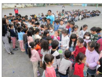
1年生を迎える会 (メダルのプレゼント)

4月12日に「1年生を迎える会」を行いました。1年生は2年生から6年生に迎えられ、瀬谷第二小学校の仲間入りをしました。教室では興味をもって勉強し、休み時間には校庭や教室で友達と楽しそうに遊ぶなど、生き生きと学校生活を送っています。給食も栄養教諭や調理スタッフがびっくりするほどよく食べています。避難訓練の時にも話をしないでしっかりと避難することができました。1年生の成長が楽しみです。