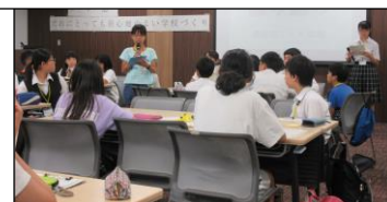
横浜こども会議（瀬谷区役所）

☆ 横浜こども会議（7月23日 下瀬谷中、8月27日 瀬谷区役所）が開かれ、運営委員会の代表の子どもたちが参加しました。この会議は平成25年度から始まり、子ども自らがいじめのない学校