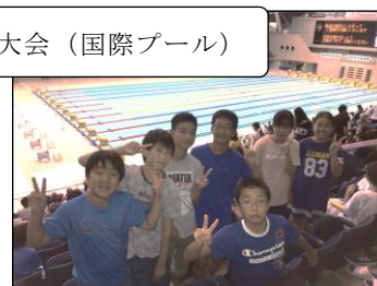
市水泳大会（国際プール）

夏休み明けの朝会は、蒸し暑い体育館の中でしたが、いつものように、落ち着いた雰囲気の中行うことができました。瀬谷第二小学校の子どもたちのよいところの一つです。これからの学校生活を充実させるために、私から子どもたちに2つの話をしました。一つ目は、いろいろなことに一生懸命取り組んだり、チャレンジしたりすること、二つ目は、友達と仲良くしたり、友達を大切にしたりすることです。日々の学習や生活、運動会などの行事を通して、一人一人の子どもがさらに成長し、笑顔で過ごせる学校づくりを進めていきたいと考えています。ご理解・ご協力をよろしくお願いいたします。