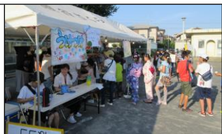
PTAブース（ふるさと祭）

PTA本部役員さん、運営委員さんによる射的、スーパーボールすくいブースも工夫が凝らされ大盛況でした。お忙しい中、子どもたちのために準備・