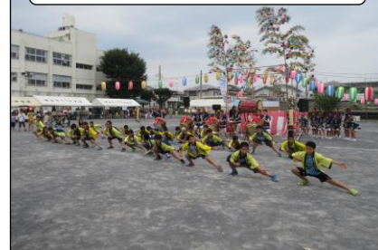
ソーラン節（ふるさと祭り）

☆ 横浜こども会議（7月23日 下瀬谷中、8月27日 瀬谷区役所）が開かれ、運営委員会の代表の子どもたちが参加しました。この会議は平成25年度から始まり、子ども自らがいじめのない学校