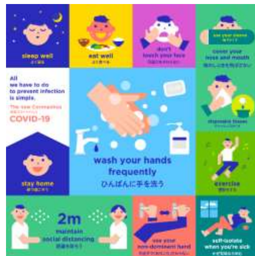
感染予防のために、できること。