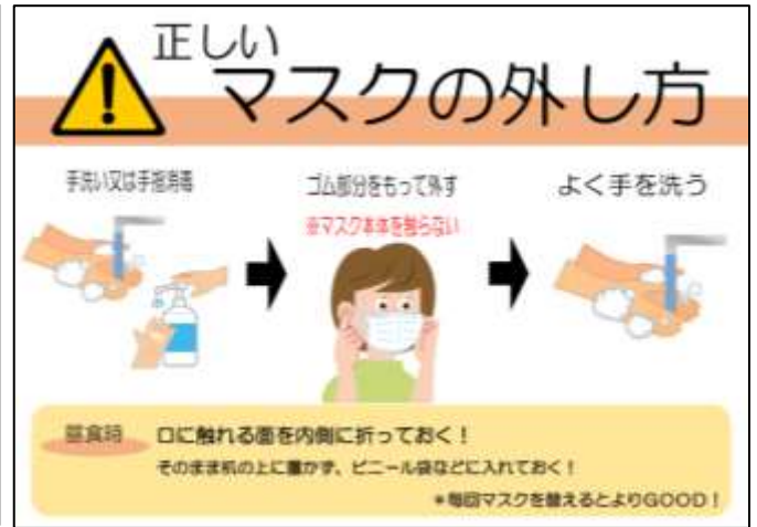
山口県山陽小野田市ホームページより