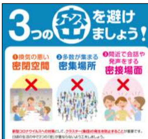
厚生労働省ホームページより