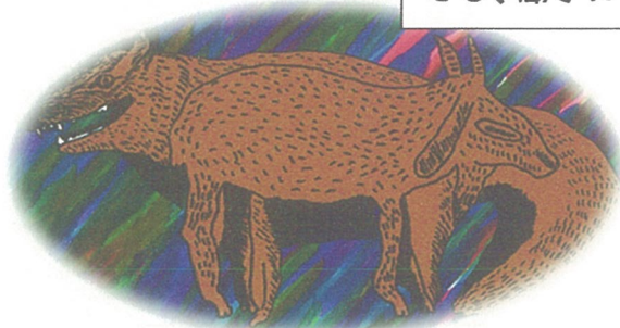
ゆうじょうものがたり