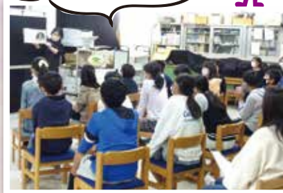
すみれっ子広場(本の読み聞かせ)