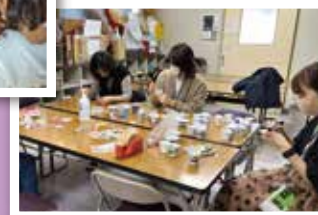
ベルマークサークル