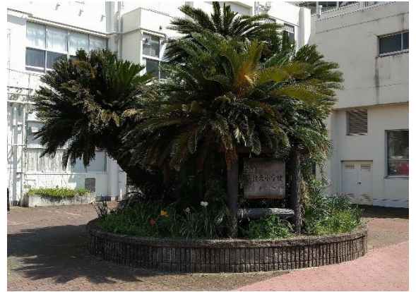
令和5年4月4日のソテツの木

50周年を迎えた今年度、さらに子どもたちの輝く笑顔があふれる学校を目指して、教職員一同一丸となって教育活動に取り組んでまいります。どうぞ、よろしくお願いいたします。