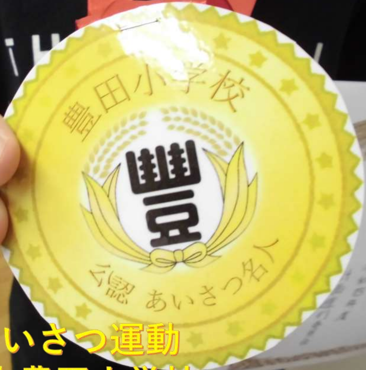
朝のあいさつ運動 横浜市立豊田小学校