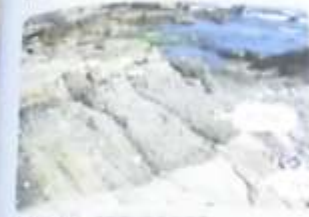
石灰岩 水底にたまりたい積