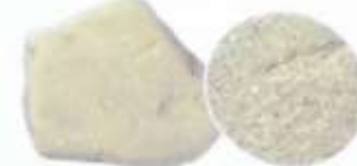
頁岩 水底にたまりたい積