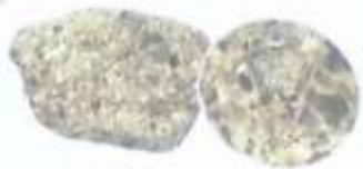
砂岩 水底にたまりたい積