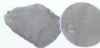
頁岩 水底にたまりたい積