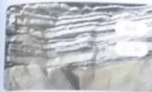
頁岩 水底にたまりたい積