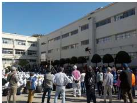
栄消防署による救助訓練