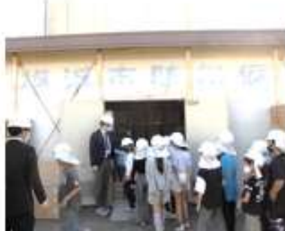
(4年防災備蓄庫見学)