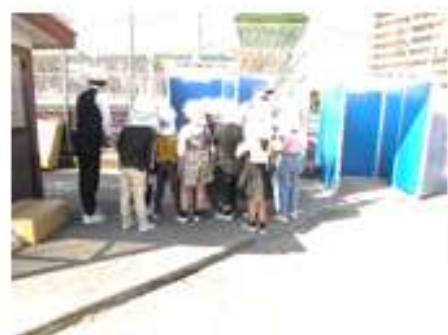
(3年災害対策用トイレ見学)