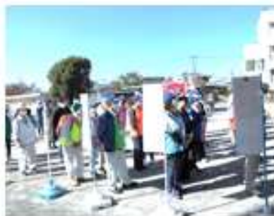
(地域防災委員の方々) (栄消防署デモンストレーション)