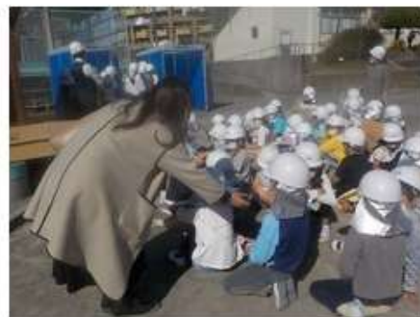
生徒へのインタビュー