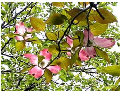
校門のそばに咲くハナミズキ

現在、ハナミズキが薄紅色の花を咲かせています。原産地は北アメリカ、1912年、東京がニューヨークに桜（ソメイヨシノ）を送った際、その返礼として、日本に贈られたのが最初といわれています。アメリカ東海岸の方では、春の終わりに開花が移送する模様を「ハナミズキ前線」と報道されることもあるそうで、日本の「桜前線」と似ていますね。この他にも、たくさんの木々が子どもたちを見守っています。