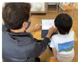
5・6組 個別学習 国語 ことばあつめ

端末の配付が決定して以来、iPad を用いて資質・能力を伸ばしていくにはどのように授業や家庭学習を組み立てたらよいただろうと、教職員は各々アイデアを出し、学習のスケジュールを組み立てました。子どもの反応を見ながら改善する日々でしたが、子どもの吸収力の速さとその効果を実感しながら、「子どもが iPad を文具のように活用する日」が近いこと、教育現場での「パラダイムシフト」が今進行中であることを確信した一ヶ月でした。