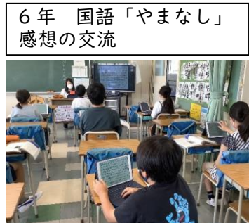
6年 国語「やまなし」 感想の交流