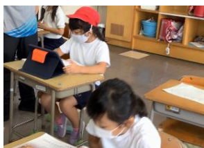
2年 音楽「こぎつね」 歌の発表(録音)鑑賞