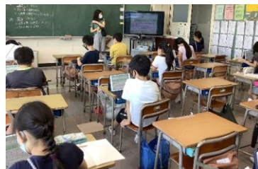
4年 社会「地域で受け継がれてきたもの」情報の共有