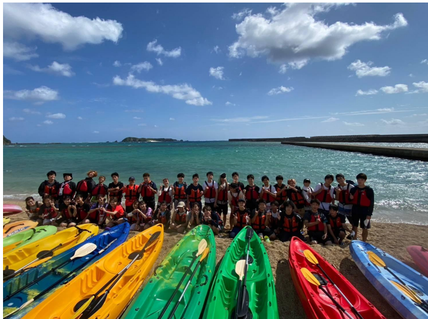
こちらは無人島シーカヤック