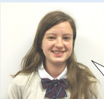
Sonia (オーストラリア) 2017.11~2018.1

こんにちは! 私はケロニです。このがっこうに私を むかえ入れてくれたみなさまに感謝したいとおも います。♡ みなとそうごうです。ごしたじかんはとてもすばらしいが ったです。私はみなさん優しくてきょうりょくでかたが ったです。私はわすれられないおもいでたくさんできま した。私はしあわせでいいおもいでいっぱいいたるたす かったです(もうすこしながく日本にたいざいしたかたです)!! 2しゅうがんのがっこうせいがかつでたがよいとま たができたたくさんにほんのこをまなびました。 私はココでけいけんしたことをけしてわすれません。♡ どうもあいがございました!! オンラインで私にえんらくすることをちゅうぎしないで ください。♡ さよならみなとそうごう♡私はまた日本にもどってきたい とおがっています。♡