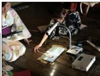
舞台裏はこんな感じです。