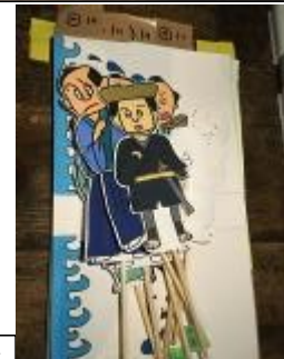
すべて手作りです。