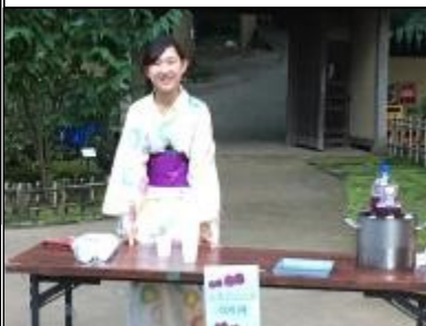
古民家スタッフの方特製の美味しい紫蘇ジュースも販売しました。