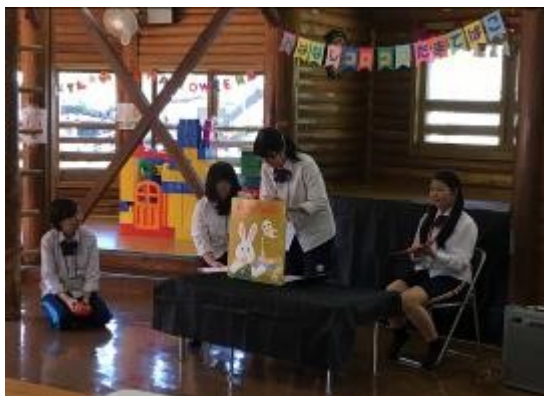
「おばけの天ぷら」の読み聞かせとクイズ

6月に続き境之谷ログハウスのイベントを10月5日に行いました。1年生2名、2年生5名の総勢7名の部員でハロウィンイベントを開催しました。ハロウィンにちなんで読み聞かせは「おばけの天ぷら」、工作はミニお菓子バケツづくりを企画しました。天気が良すぎて、また近隣の幼稚園の運動会と重なったため、6月ほどの参加者はありませんでしたが、「ありがとう」の声をたくさんいただきました。今回の反省は2020年に活かしていきます。