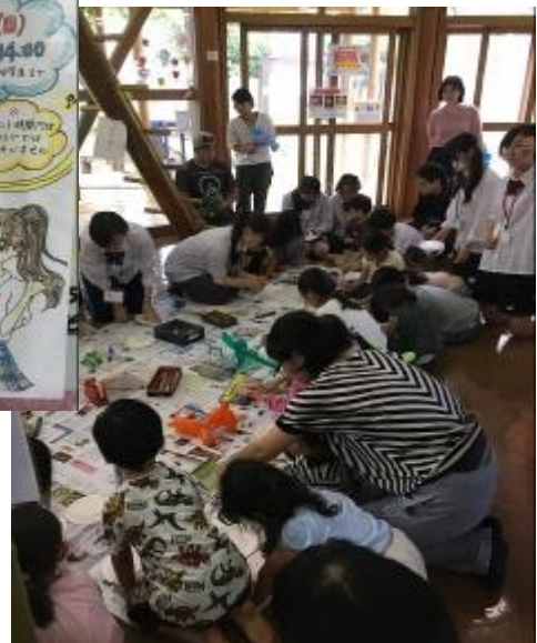
多くのお子さんに参加していただき、会は大盛況でした。