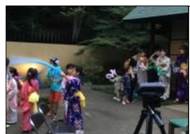
クイズの景品はバルーンアート。