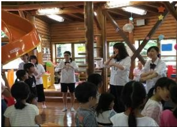
「糸まきまき」の手遊びで会をスタート。

恒例の境之谷ログハウスのイベントを6月30日に行いました。1年生3名、2年生5名、3年生2名の総勢10名の部員で企画を考え、1時間のイベントを成功させることができました。読み聞かせとクイズ、バルーンアートのプレゼント、うちわづくりと、どの企画にも多くのお子さんが参加してくれて、「ありがとう」の声をたくさんいただきました。次は10月頃の予定です。