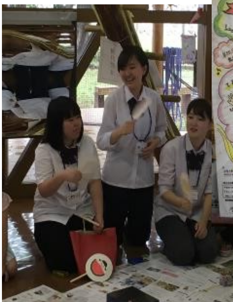
紙皿を使ったうちわづくりを行いました。2枚の紙皿に絵を描き、割り箸を付ければ即席うちわの出来上がりです。