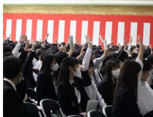
クイズに答える生徒たち

式典の後半は、「生徒の時間」として、生徒会が中心となって「大道中クイズ」や「大道中あるある」などのビデオを鑑賞しました。良く工夫された内容で、生徒も職員も来賓も、参加者みんなが笑顔になりました。