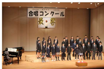
1 学年最優秀賞 2 組 「未来へのステップ」