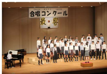
2 学年最優秀賞 2 組 「Laughter」