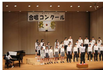
3 学年最優秀賞 5 組 「信じる」