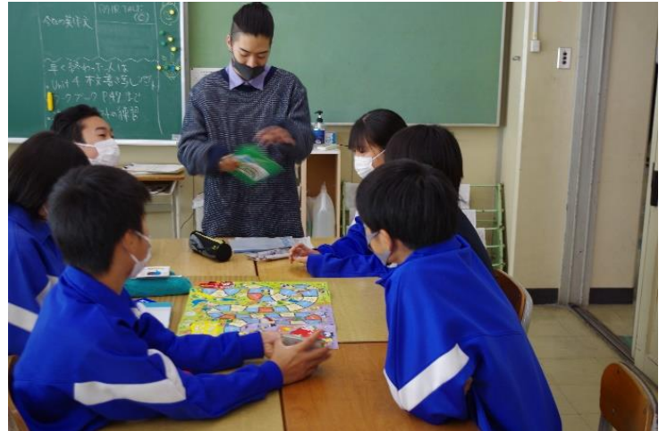
また大学生と一緒に授業をしたいですか 90件の回答