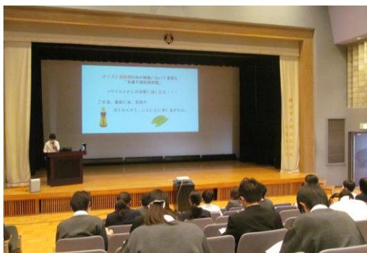
工夫されたPPは、とってもわかりやすい！