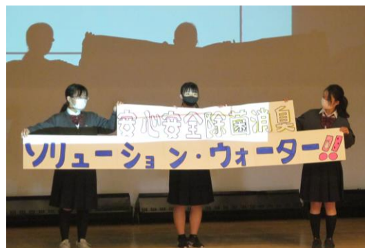
高い効果&安全性のソリューションウォーター

委員さんたちはグループ単位で各項目を担当し、発表しました。なかでも休校期間中の附属中学生の生活についてのアンケート調査は、とても興味深いものでした。