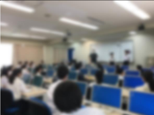
③英語 de Quiz (@ CALL 教室)