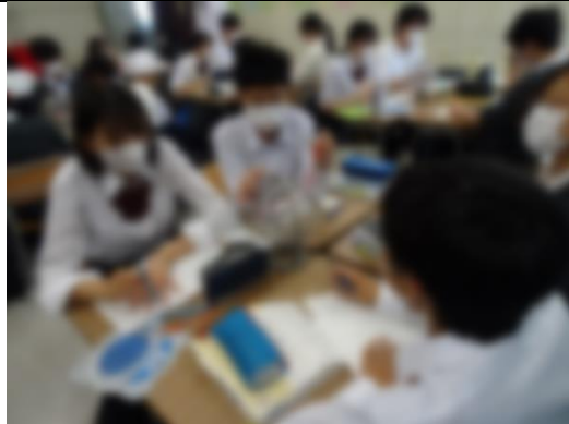
④地学の授業で天球儀を使って天体の動きを学習

【お知らせ】 6月18日(土)に予定していた第2回カナダ研修旅行保護者説明会は中止とします。9月27日(火)に「京都研修旅行」の説明会を行います。お忙しいとは思いますが、ご予約いただけたら幸いです。