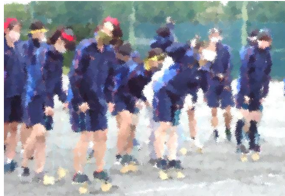
【竹ぼっくりも余裕です】