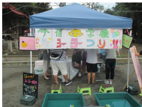
◎今宿町内・自治会連合会レクリエーション大会