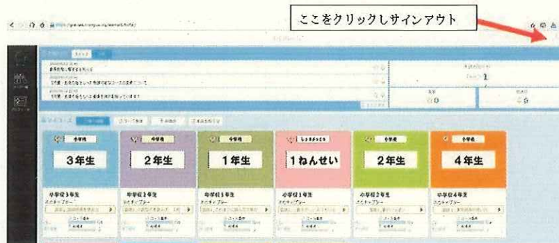
サインアウトの図について

A7: 同時には表示できませんので、一度下図のようにサインアウトをしてから、該当の学年・組のIDでログインし直してください。