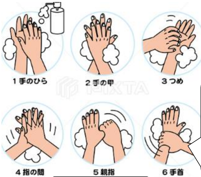
正しい手洗いの仕方

手洗いの前に… • ツメを切っておきます。 • 時計や指輪を外します。 石けんをよ〜く泡立てて！