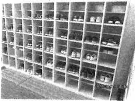
【下駄箱もいっぱい！】