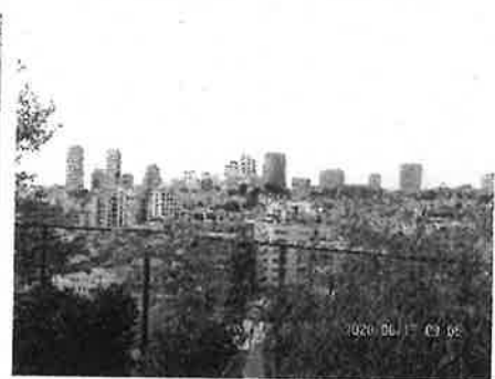
【校長室からの眺め】