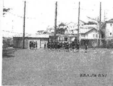
【グラウンドで授業】