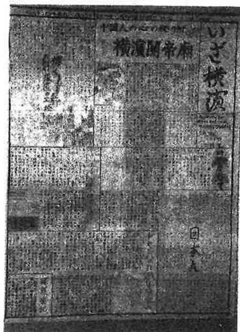
かさく よこはま ねん くみ ほん 佳作「いざ横濱」2年3組A班