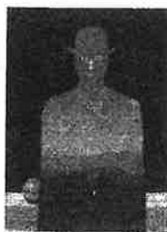
おうさま びじゅつかん 【王様の美術館】