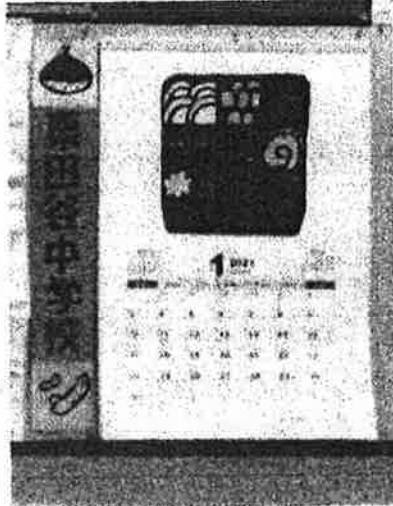
【6組作成 カレンダー】