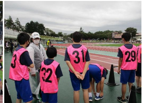
はし はばと 【走り幅跳びです】