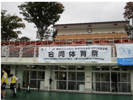
こさめ ま かいさい 【小雨交じりの開催】

10月13日（木）に時折小雨が降る中、三ツ沢陸上競技場において「横浜市立中学校個別支援級 合同体育祭」が行われました。【400m走】【ボール投げ】【走り幅跳び】【100m走】【150m走】【リレー】の各種目に6組の仲間が出場しました。私も応援に行きましたが、ひとり一人のがんばる姿が印象的でした。中でも大人気でスタートの400m走で1年生の〇〇さんが後半にごぼう抜きをして3位に入賞しました。