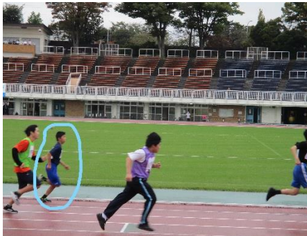
りきそう 【力走する〇〇さん】