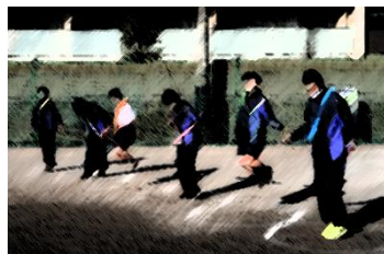
スタートのメンバー