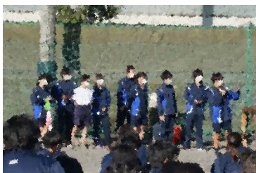
司会・運営の学級委員

12月7日(水)5校時に学級委員が中心となって企画をした学年レクを楽しみました。先生率いる「自称マッちょ隊(希望者)」によるマッちょ体操で準備体操を行いました。レクの内容は、クラス対抗による障害物全員リレー。縄跳び、ドリブル、ハードル、麻袋ジャンプの種目をしながらタスキをつなぎアンカーはなんと担任の先生。ここが一番の盛り上がりとなりました！