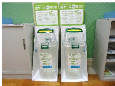
コンタクトレンズの空ケース回収BOX