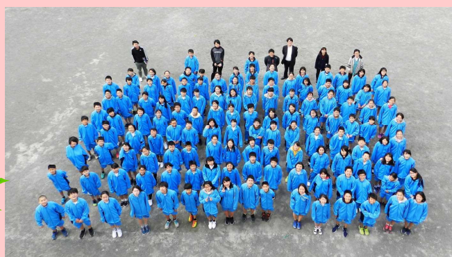
『令和元年度』新入生127名

☆今年度から宮田中学校は「3学期制」となりました。これは、夏休み前に学習の振り返りをしっかり点検し、夏休みに改善への取組を行うことができるようにすることが主な狙いです。また、定期試験の回数等、生徒の負担にならないように配慮しており、年間の行事の配置も昨年度までと同様となっています。連絡票の配布時期を含め、詳細は5/10(金)の「教育活動説明会」でお知らせいたします。