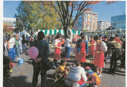
子どもたち相手に、ヨーヨーすくと販売

また、11月5日の地域清掃には、女子バレー部の生徒たちが参加しました。公園は前日の強風のため、落ち葉が大量にあり、集積場は落ち葉が入った袋の山となりました。生徒たちのお手伝いがなければ、大変なことだったと、参加した地域の方々がお話され、大変感謝されていました。12月3日の地域清掃は、大量の落ち葉があると思います。皆さん、積極的に参加しましょう。