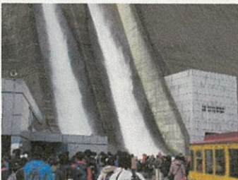
観光放流に大歓声