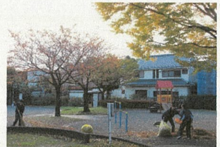
落ち葉をかき集める生徒たち