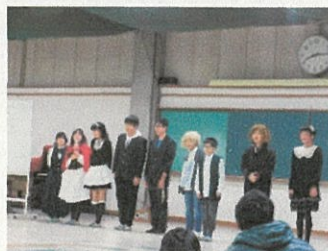
スタンツ発表を終えた中川中生

11月22日から1泊2日の日程で愛川ふれあいの村において、都筑区個別支援学級合同宿泊学習会が行われました。宮ヶ瀬ダムでは、観光放流を見学して大歓声。