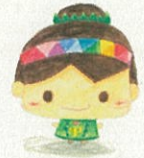
中川中キャラクター 「みどりん」