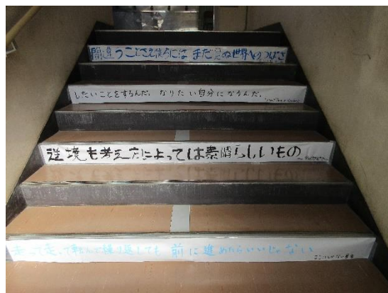
3年生のフロアに続くメッセージ

3年生のフロアまで続く階段に、3年学級委員のみなさんによるメッセージが貼られています。写真のように『逆境も考え方によっては素晴らしいもの』（シェイクスピア）という類の元気づけられる、前向きな気持ちになるメッセージが続きます。頑張り、受験生！