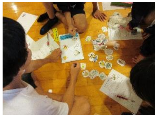
『試験』に備えた朝食メニューを考え中！

9月7日、個別支援級区交流遠足でズーラシアに行きました。11月に行われる区合同宿泊学習会に向け、区内8校の生徒たちで構成された班単位で園内を見学しました。班長を中心に、みんなで協力し、オカピをはじめたくさんの動物を見学した楽しい遠足でした。