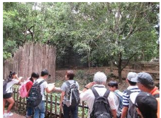
ズーラシアの動物に興味津々！