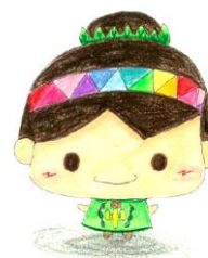
中川中スクールキャラクター 「みどりん」