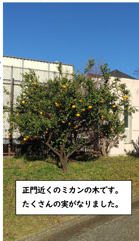
正門近くのミカンの木です。 たくさんの実がなりました。