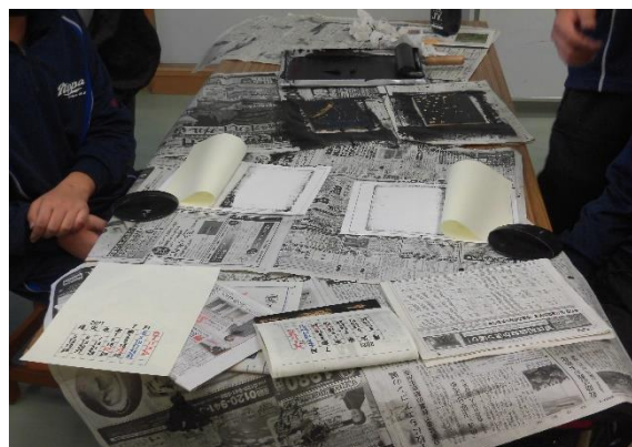
【ホームページ掲載のため生徒名はイニシャルにしています】