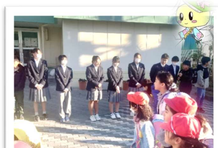
西本郷小での「あいさつ運動」