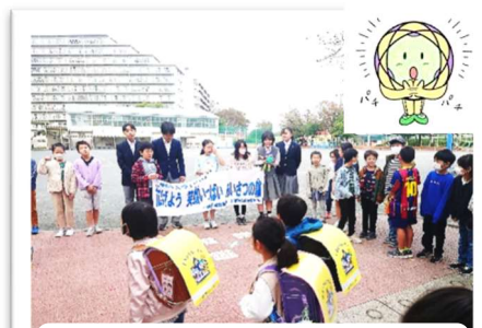
笠間小での「あいさつ運動」