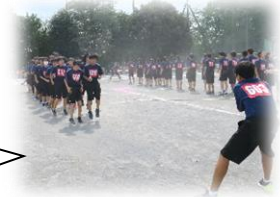
大縄跳び優勝 2年6組