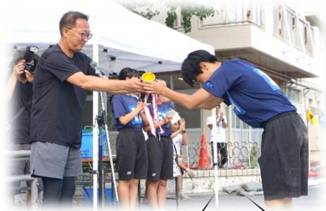
総合優勝3年3組へトロフィー授与