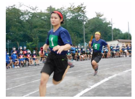
【色別対抗リレー：3年生】