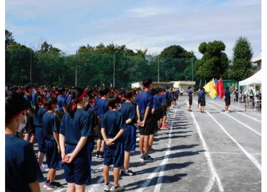
【選手宣誓中：開会式より】

体育祭のスローガン、「 全力！青春サイダー～Do Your Best～ 」に込められた目標は間違いなく達成できたのではないのでしょうか。学校全体で、1か月後の飛躍祭により流れをつくることのできたと思います。生徒の皆さん、大変お疲れ様でした。