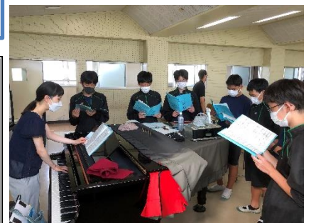
【合唱コンクールに向けての練習も始まっています！：3年生音楽の授業より】