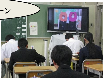
【1/19 学校保健委員会ウイーク：昼食時TVで地産地消等の紹介(保健安全委員会)】