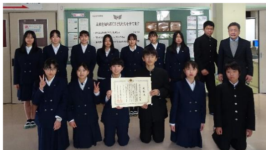
【優秀作品受賞の生徒とともに記念撮影】

2月10日、本校が長年にわたり、「全国中学生人権作文コンテスト」に協力（全校生徒による取組）をして、中学生の人権意識の高揚に尽力しているとの評価を受け、法務省及び全国人権擁護委員連合会より感謝状を贈呈していただきました。大変、名誉なことと受けとめています。