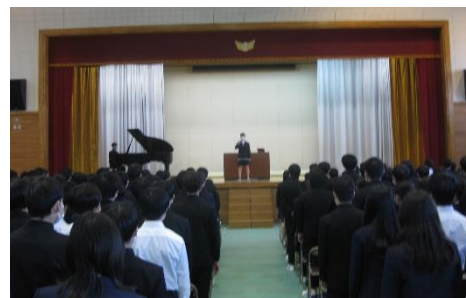
【2月21日卒業式練習始まる（3年）】

保護者、地域、関係者の皆様には、今年度の最後までご支援をよろしくお願いいたします。