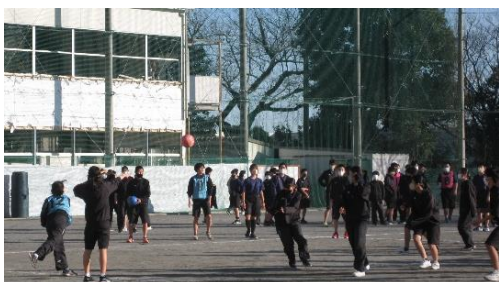
【1/20 今回も熱く燃えたドッジボール大会(2年)】