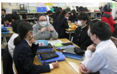
【1/18 Super English Program(2年)】