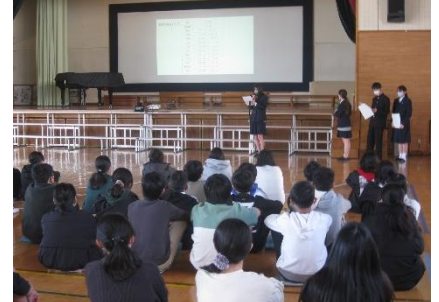
【2/21 岡津小で6年生に中学校生活等について紹介(生徒会本部役員3年)】