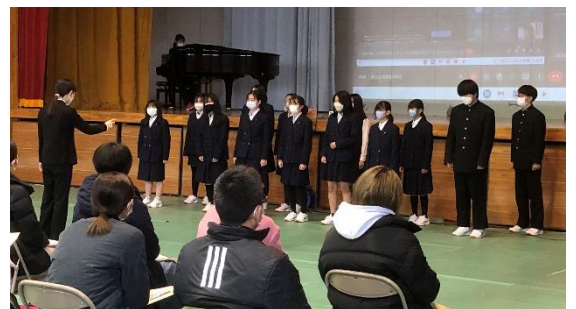
【2/7 新入生保護者説明会で合唱部が校歌を披露 そのあと生徒会本部役員が学校生活について説明】