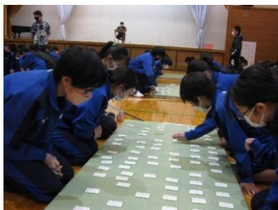
【1/27 寒いけど頑張った!百人一首大会(1年)】