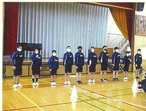
▲権小・境小・境中3校における個別支援学級交流会 （11/24、境中の発表の様子 @境小体育館にて）

いよいよ令和2年も残すところ後1カ月となりました。振り返ってみれば、コロナウイルスの影響でこの1年は色々なことがありました。特に3月からの3カ月間（～5月）の休校は予想できなかった大変なことでした。今年ラストの1カ月を良い形で終え、令和3年はよりよいスタートを切っていけるよう、子ども達の学びを支援してまいります。