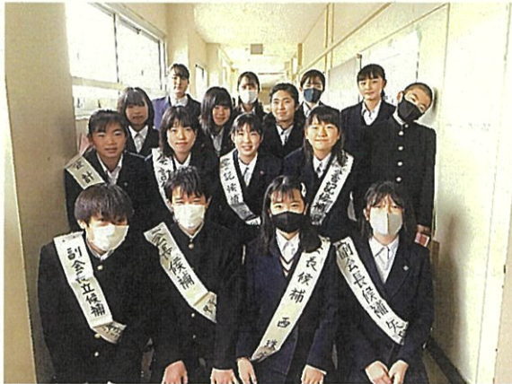
▲演説後の立候補者および応援演説者の皆さん

生徒会役員選挙が11/20（金）行われました。 生徒会選挙は、次代の境中生徒会を担う人材を選出し、生徒主体の生徒会に、自ら参加する姿勢をもつ大切な取組です。生徒の皆さんは、生徒会会員としての意識を高めて投票しました。